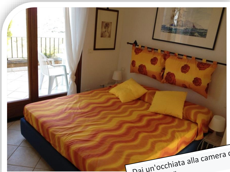
Dai un'occhiata alla camera da letto "gialla".