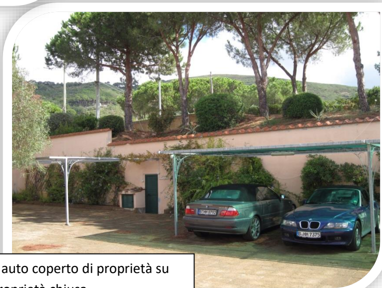
Posto auto coperto di proprietà su una proprietà chiusa