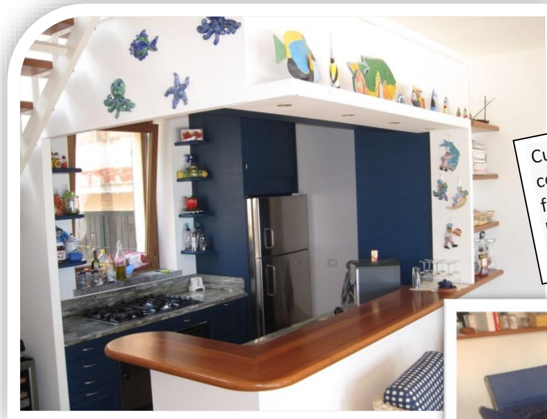
Cucina aperta con piano cottura a gas, combinazione frigorifero/freezer, lavastoviglie, macchina per il caffè