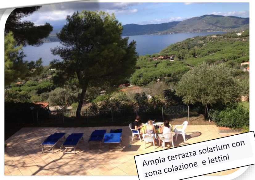
Ampia terrazza solarium con zona colazione e lettini