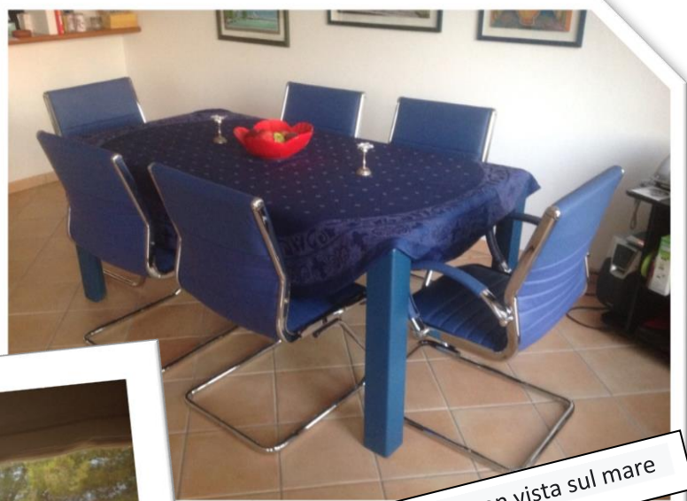
Zona pranzo con vista sul mare